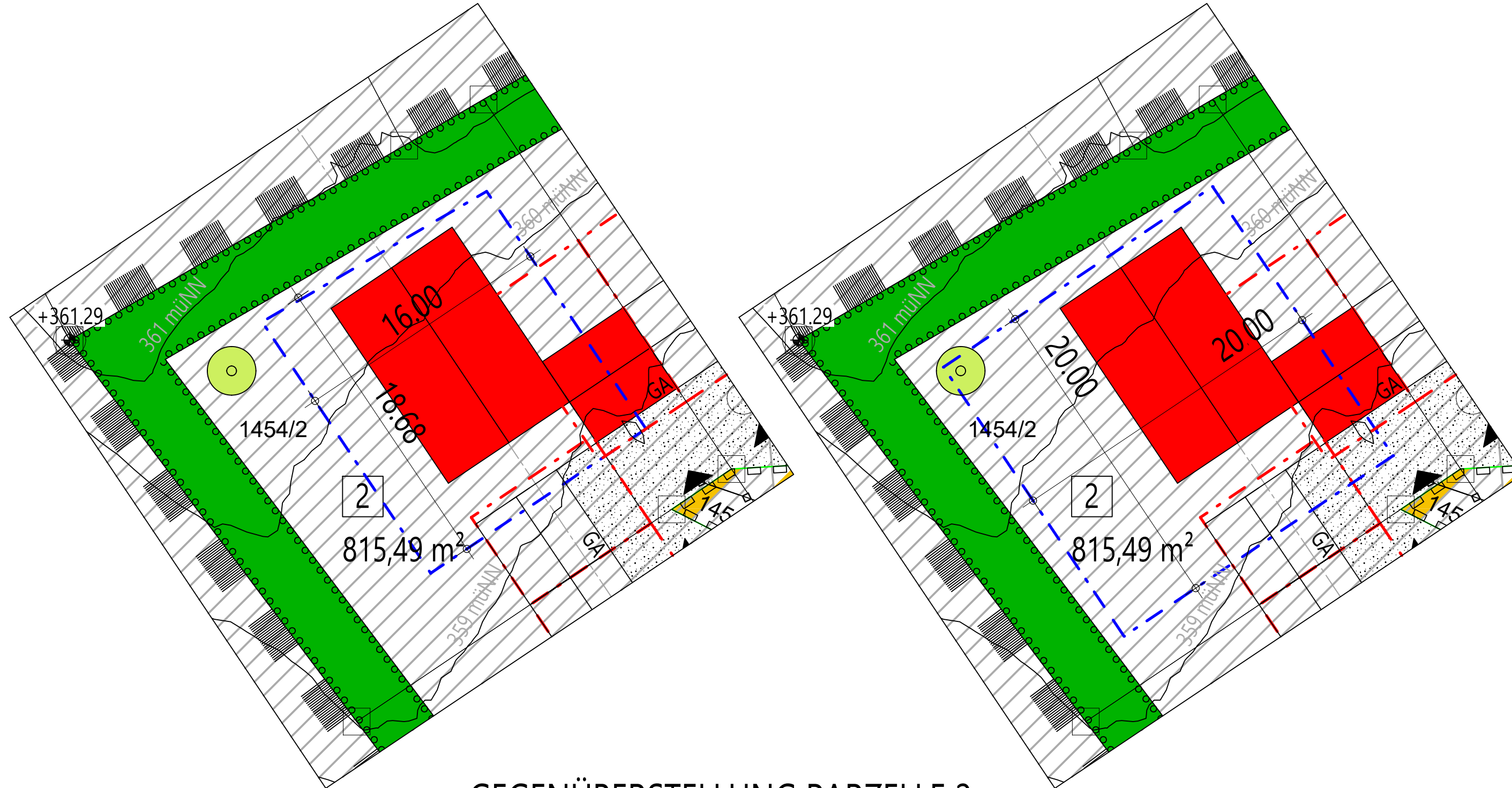
GEGENÜBERSTELLUNG PARZELLE 2 (VERGLEICH BAUFENSTER)