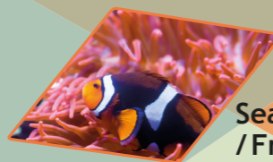
Sealife (München) / Freibad Wolzach