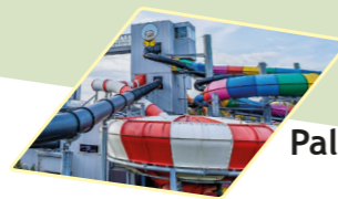
Palm Beach (Nürnberg/Stein)