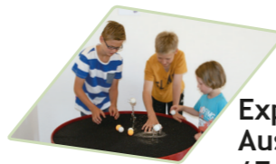
Experium - Museum zum Ausprobieren (Furth im Wald) / Freibad Cham

(Frühere Ankunft ab 17 00 Uhr bei der Eisdielen in Obertraubling, gemeinsames Eisessen, Abholung zwischen 17 30 und 18 00 Uhr)