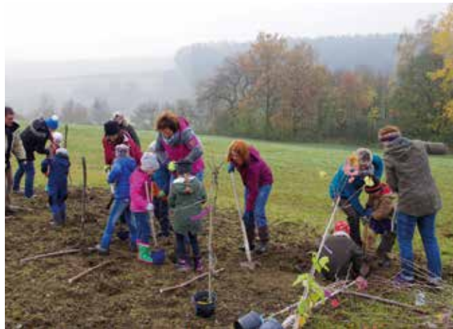
Gemeinsam pflanzen, pflegen und erhalten die OGV im Landkreis Streuobstwiesen.