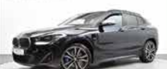
BMW X2 M35i

EZ 03/2022, 10.910 km, Benzin, 225 kW (306 PS), Klimaaut., Navigation Plus, M-Lederlenkad, Rückfahrkamera, u.v.m.