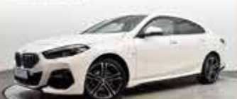
BMW 218i Gran Coupé

EZ 05/2022, 15.119 km, Benzin, 100 kW (135 PS), Sportsitze, PDC, BMW Live Cockpit Prof., M-Leder- lenkrad, Comfort Paket, u.v.m.