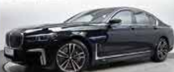
BMW 750i xDrive

EZ 05/2022, 23.403 km, Benzin, 390 kW (530 PS), Klimaaut., BMW Head-Up Display, Glasdach elektrisch, PDC, u.v.m.