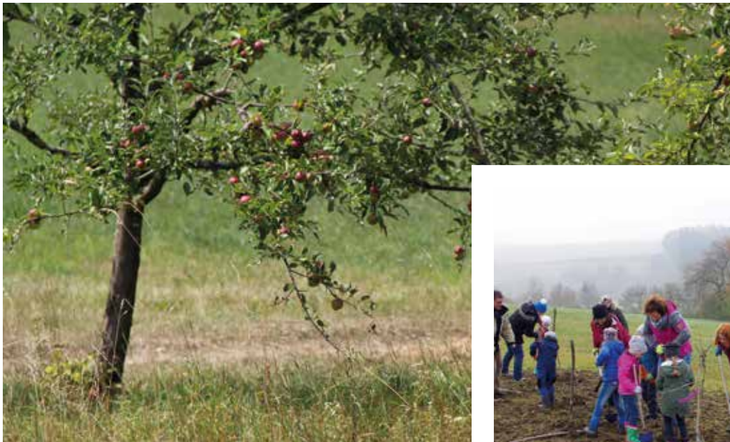
Streuobstwiese, ein Lebensraum für zahlreiche Tier und Pflanzenarten.