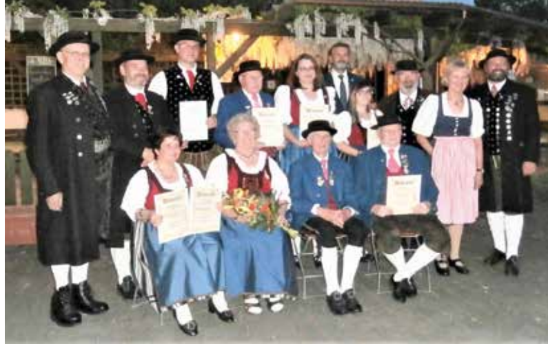
Textquelle: Besler L.

Harald Listl bedankte sich anschließend für die Tradition der Maiandacht, die jedes Jahr recht feierlich zelebriert wird. Im Hinblick auf das Großereignis im Juli, bei dem 100 Jahre „Holzhacker“ und 100 Jahre Gau Niederbayern gefeiert wird, freut er sich auf gutes Gelingen und schöne Stunden.