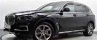
BMW X5 xDrive30d xLine

EZ 07/2022, 12.900 km, Diesel, 210 kW (286 PS), PDC, Navigati- onssystem, Klimaaut., Panorama Glasdach elektrisch, u.v.m.