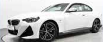
BMW 220i Coupé

EZ 07/2022, 19.306 km, Benzin, 135 kW (184 PS), Klimaaut., PDC, Parking Assistant, Navigations- system, Sitzheizung, u.v.m.